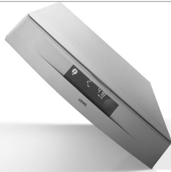
DVD-Player und Fernseher bilden eine Einheit: Der XEMIX lässt sich bequem über die Fernbedienung des Loewe Fernsehers steuern.

Ebenfalls zum Abschluss gebracht werden konnte die Entwicklung der Online-Plattform TVO 3 und deren Implementierung in das MediaPlus-Chassis.