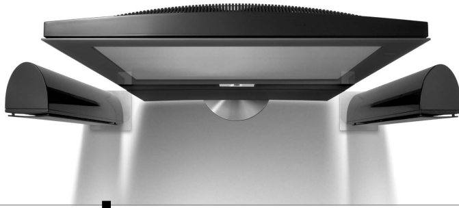
Überzeugende Technik von Sehen und Hören im Surround-Sound: der Spheros S mit MediaPlus-Technologie