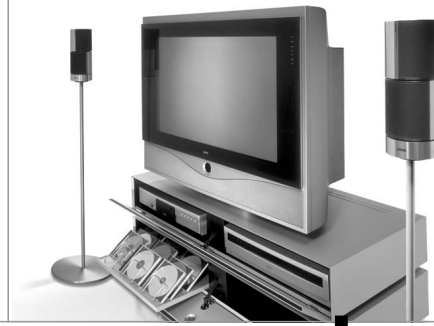
Stauraum mit Eleganz: der Articos 32 auf Cube 2

Das im einzustellenden Geschäftsbereich Telekommunikation gebundene Vermögen nach Abzug der Schulden betrifft im Wesentlichen Vorräte und Lieferungsorderungen sowie Sonstige Rückstellungen. Der Rückgang gegenüber dem Jahresende 2001 resultiert vornehmlich aus dem Abbau der Vorräte um 5,9 Mio. Euro auf 0,7 Mio. Euro und der Reduktion der Lieferungsverbindlichkeiten um 3,1 Mio. Euro auf 0,2 Mio. Euro. Im 3. Quartal werden die zum 30.6.2002 bilanzierten Forderungen aus Lieferungen und Leistungen in Höhe von 4,0 Mio. Euro weiter reduziert und die verbleibenden Vorräte abverkauft.