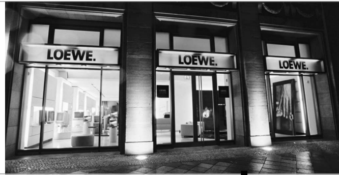
Loewe in Berlin: die neue Galerie „Unter den Linden“

Im 2. Quartal ist mit dem Kooperationspartner Gira das „Home Automation Starter Kit“ in den Markt eingeführt worden. Mit Wireless Home Automation wird die Bedienung vieler funkgesteuerter Elektroinstallationen im Haus via Loewe TV möglich – ganz einfach per Tastendruck auf der Loewe Fernbedienung. Das Fernsehgerät von Loewe mit dem neuen Internetmodul Loewe OnlinePlus ist dabei die zentrale Schnittstelle für ein intelligentes Zuhause.