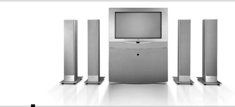
Kinoerlebnis zu Hause: Der Aconda bietet mit integriertem Dolby-Digital-Aufrüstsatz ein atemberaubendes Klangerlebnis.